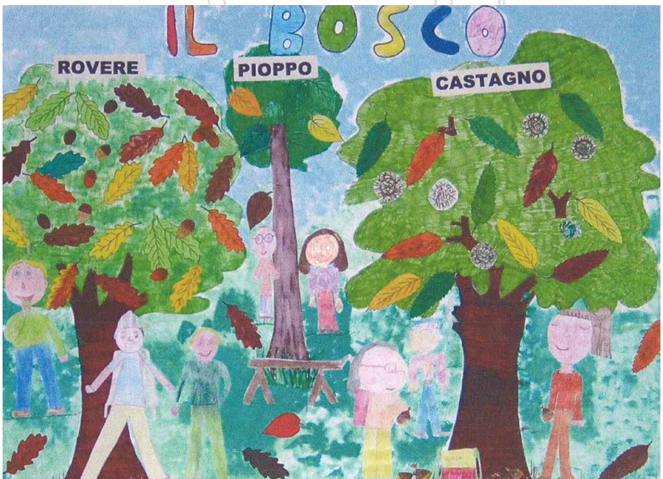
Classe 2ª - Scuola Elementare