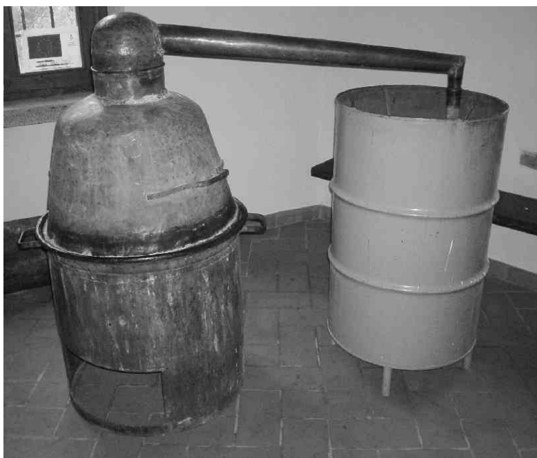
Immagine del "Lambic" acquistato per il Museo.

In prospettiva il Museo del Lambic costituirà uno dei punti di partenza della "strada del vino" (l'antica Via Valeriana) che le Amministrazioni comunali di Malegno, Losine e Cerveno sono impegnate a rivitalizzare col rilancio della produzione viti-vinicola di qualità.