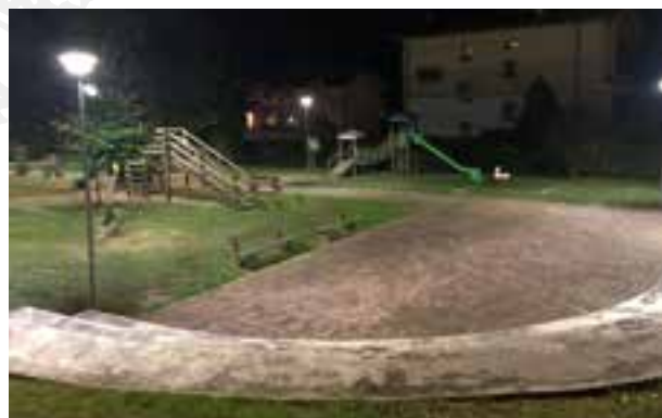
"Nuova illuminazione a LED per il parco giochi"