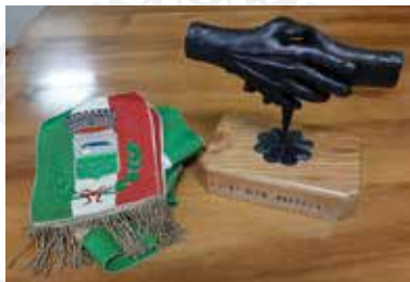
L'opera che viene consegnata al Mites 2020 ricorda che chi svolge volontariato "dona" la propria mano a chi ha più bisogno.

La quotidianità all'interno del Centro è trascorsa contatto tra la preoccupazione del contagio e la necessità di aiutare. Senza enfasi possiamo dire di essere un punto di riferimento per una Comunità che chiedeva fatti, aiuti, notizie autorevoli e certificate, ma aveva nel cuore la coriacea volontà di una reazione tipica della gente camuna.