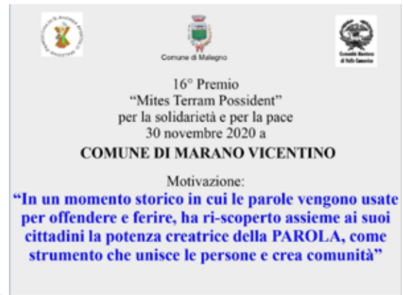
Nella foto a sinistra MARANO VICENTINO, il Premio Mites 2020. Nella foto a destra la motivazione del premio a MARANO VICENTINO