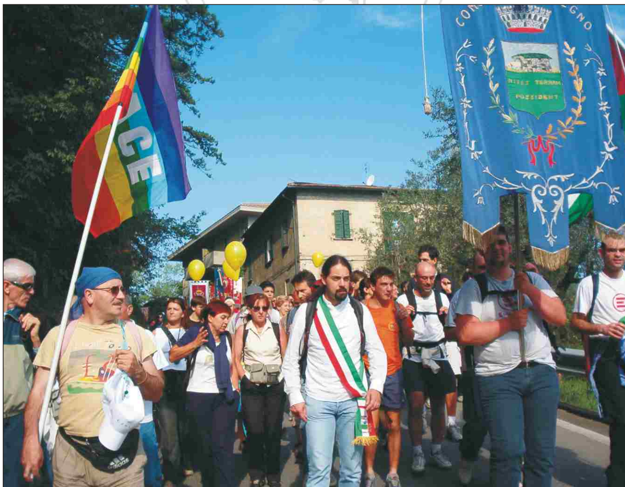
Particolare della delegazione malegnese alla marcia Perugia-Assisi