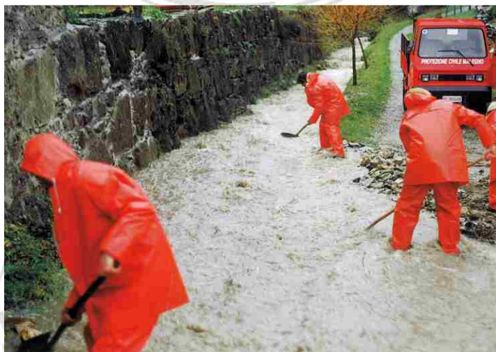
Intervento della Protezione Civile in prossimità dell'Arca

Su proposta del Gruppo malegnese della Protezione Civile l'Amministrazione Comunale ha ritenuto di organizzare una simulazione di evacuazione delle zone limitrofe al fiume Oglio e della parte finale del torrente Lanico (praticamente dal Ponte Mi-