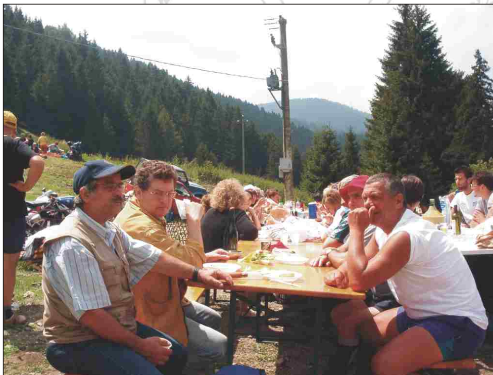
Pic-nic alla Malga Vajuga