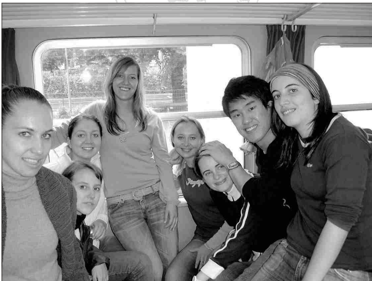
Otto dei dodici ragazzi del campo estivo di lavoro